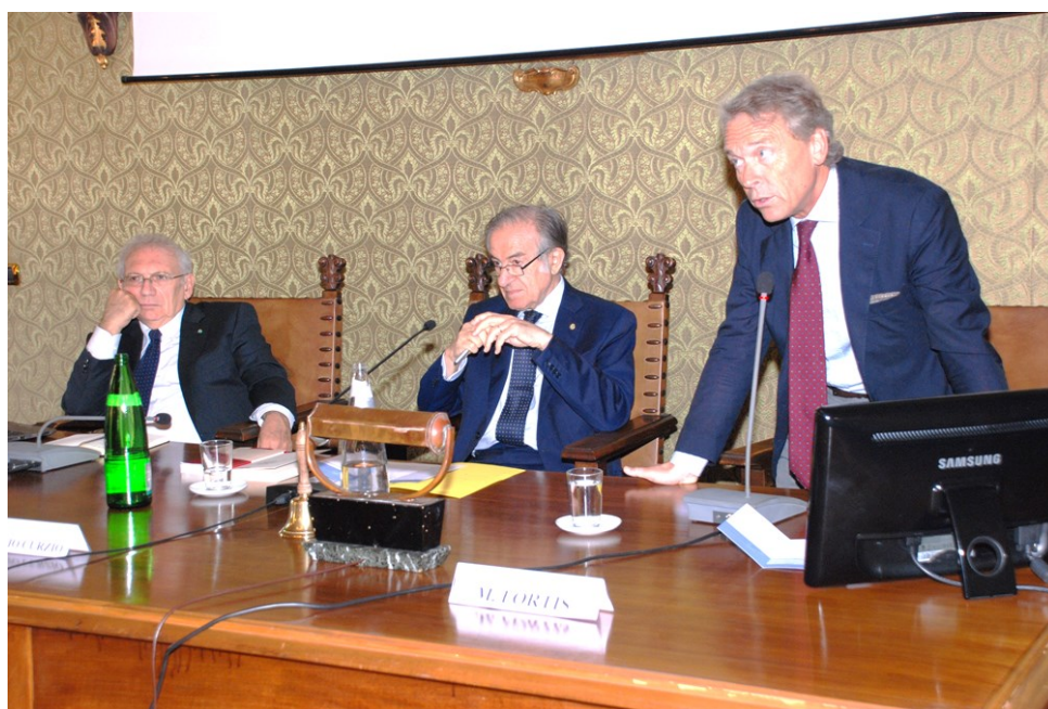
Da sinistra: Patrizio Bianchi, Alberto Quadrio Curzio e il professor Fortis