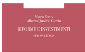
Collana della Fondazione Edison