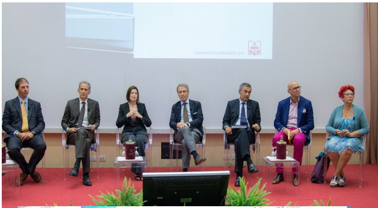
A sinistra la tavola rotonda dal titolo "Nautica: il ritorno, il futuro" di Ucina