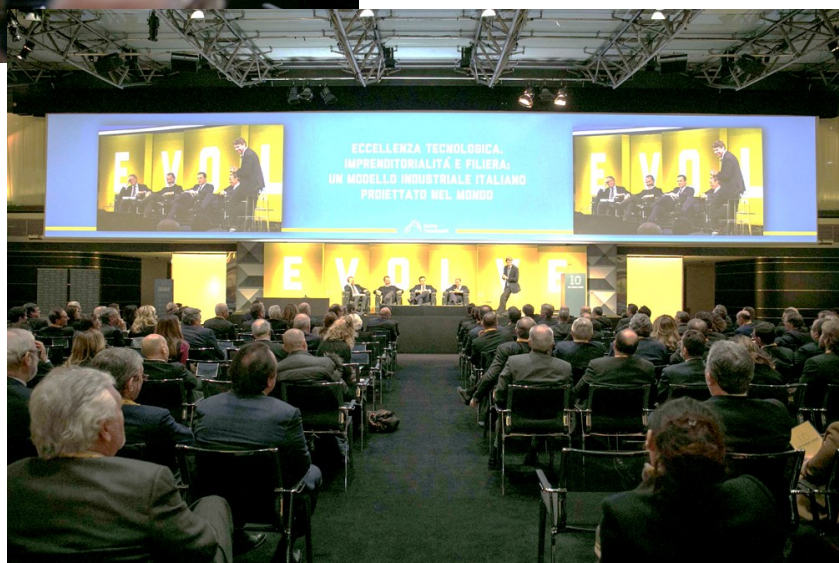
In alto i partecipanti all'incontro "The Evolve Event. 2007/2017 – Dieci anni in Borsa", organizzato da Maire Tecnimont