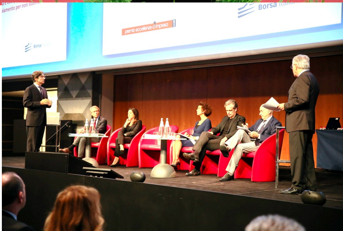
A sinistra i relatori al premio "Eccellenze d'impresa" per il 2017, promosso da Gea e Harvard Business Review