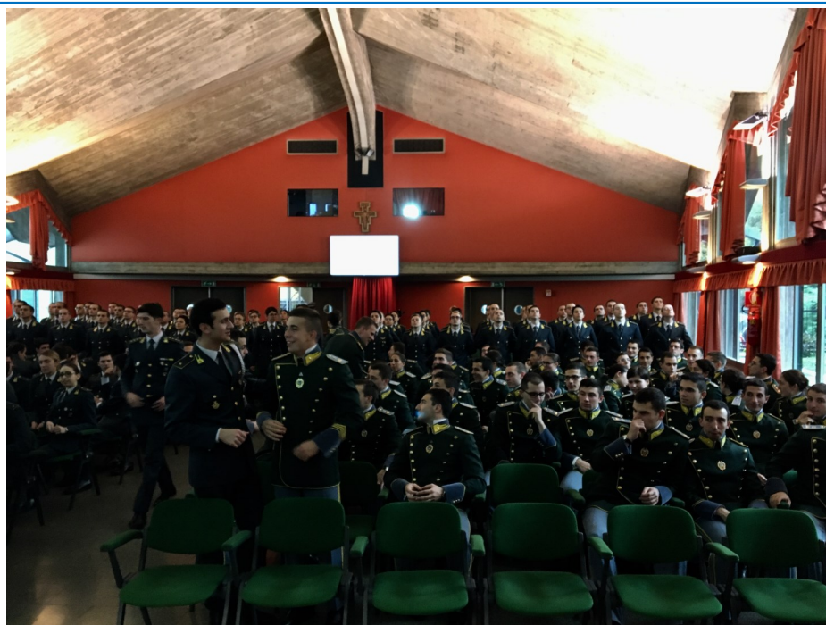
A destra incontro presso la Guardia di Finanza a Bergamo, organizzato da Ambrosetti