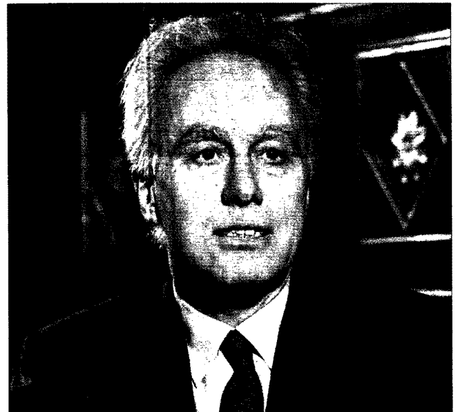
Dall'alto a sinistra in senso orario: Mario Monti, Lorenzo Bini Smaghi, Luigi Spaventa, Francesco Giavazzi