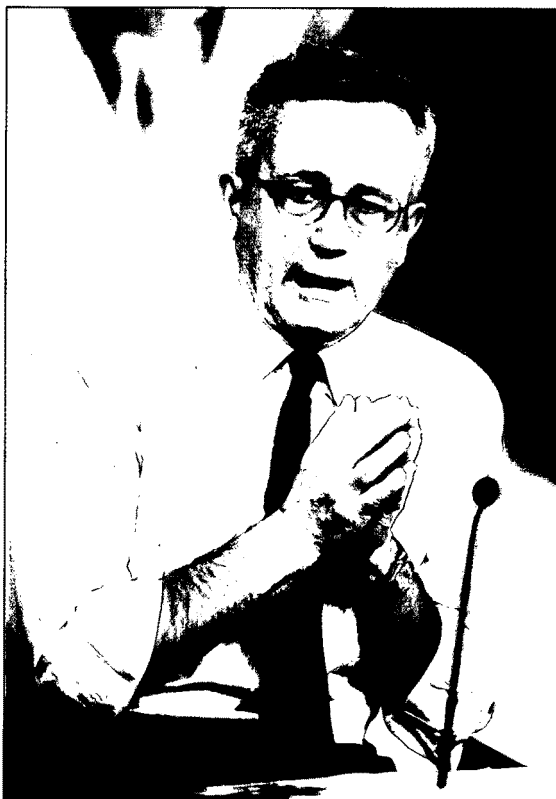
Il ministro dell'Economia Giulio Tremonti durante la conferenza stampa in cui, il 28 novembre, ha illustrato le misure anticrisi decise dal governo.

Buono il rapporto invece con Il Messaggero e il suo direttore Roberto Napolitano, detto il "morbidone" per l'aria pacioccona e per la sua capacità di interloquire con i potenti. Napolitano piace anche a Berlusconi (non a caso è amico di