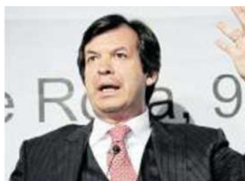
Carlo Messina , consigliere delegato di Intesa Sanpaolo