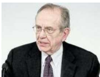
Pier Carlo Padoan ministro dell'Economia