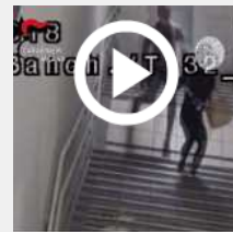
Molestata in stazione, salva grazie a spray