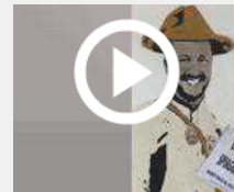
Salvini 'Vù cumprà', Tv Boy colpisce ancora