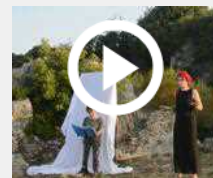
A Terracina il mito di Ulisse sorge all'alba