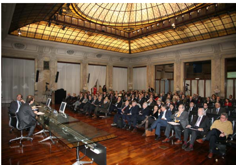
Conferenza stampa ANIMA nella sala delle Assemblee Edison