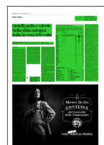
Superficie 39 %

«La forza dell'Italia - aggiunge Fortis - è anche legata al rilancio degli investimenti degli ultimi anni, con i piani di incentivazione 4.0 in grado di generare un circolo virtuoso sia in termini di valori assoluti di impegni economici che di risultati in competitività. Se guardiamo alla produttività dell'area manifatturiera, anche in questo caso da anni i nostri risultati sono superiori rispetto