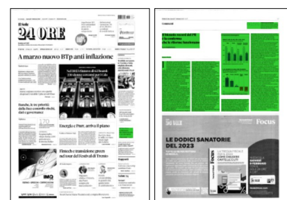
Superficie 39 %

Nel 2015-2018 furono raccolti i primi frutti di quei