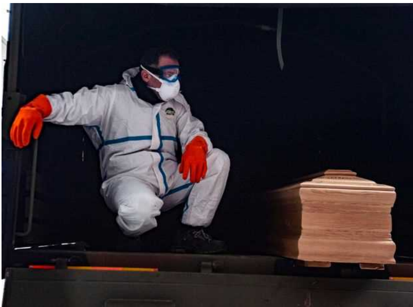
Esercito Italiano trasporta feretri su camion

02/04/2020 14:59 CEST | Aggiornato 32 minuti fa