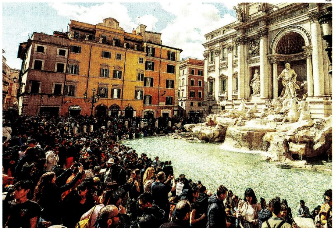
Folla.. Un tipico pomeriggio romano alla Fontana di Trevi

più negli alberghi; 3,6 milioni in più nei B&B e negli agriturismi; 410 mila in più nei camping e nelle aree attrezzate per camper e roulotte.