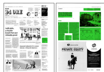
Superficie 44 %

quadrimestre gennaio-aprile 2023 rispetto allo stesso periodo del 2022. Di fatto, l'Italia ha quasi completamente riguadagnato i livelli di presenze straniere nel complesso degli esercizi ricettivi dei primi quattro mesi del 2019, anno antecedente lo scoppio della pandemia. E verosimilmente, andando avanti di questo passo, il 2023 si chiuderà con un nuovo record annuale di pernottamenti. Infatti, negli ultimi dodici mesi, da maggio 2022 ad aprile 2023, le presenze di stranieri sono state pari a 213,7 milioni di notti, cifra ormai non molto distante dal precedente picco di 220,8 milioni toccato nei dodici mesi da marzo 2019 a febbraio 2020. Gli incrementi di presenze straniere nel complesso degli esercizi ricettivi rispetto allo scorso anno hanno presentato un ritmo davvero impressionante nei primi due mesi del 2023: +90% a gennaio e +73% a febbraio, in confronto con gli stessi mesi dello scorso anno. Poi vi è stata una decelerazione ma anche i mesi di marzo ed aprile hanno messo a segno aumenti significativi, rispettivamente del 32% e del 20%. I 12,7 milioni di presenze straniere in più nel primo quadrimestre di quest'anno si sono così ripartiti: 8,7 milioni in più in alberghi; 3,6